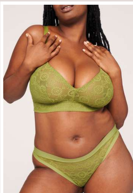
Debby triangle vert en 100E + Tanga 42