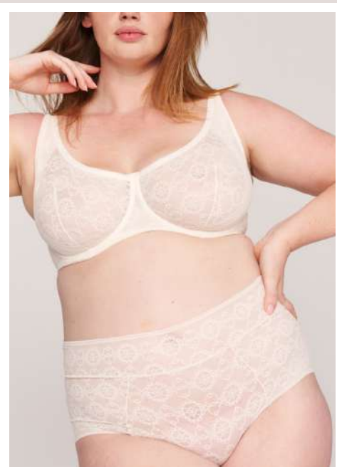
Debby corbeille écu en XL + shorty Debby écu 42