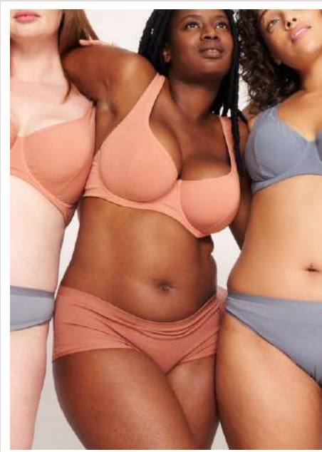
GIL corbeilles + tanga, shorty et culotte existe en blush, gris et noir