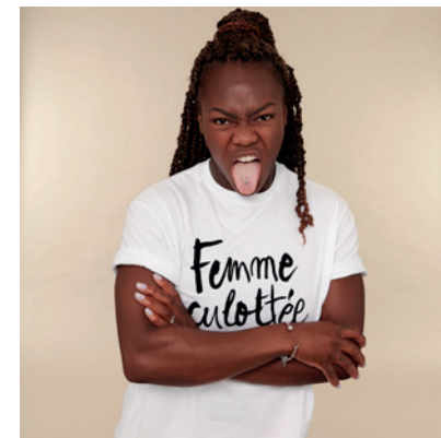
Clarisse Agbegnanou Judoczka