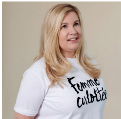
Héléne Darroze Szefowa kuchni