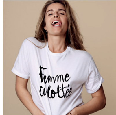
Sonia Sieff Fotografka