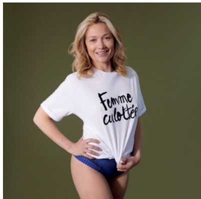
Caroline Vigneaux Komiczka, aktorka i reżyserka