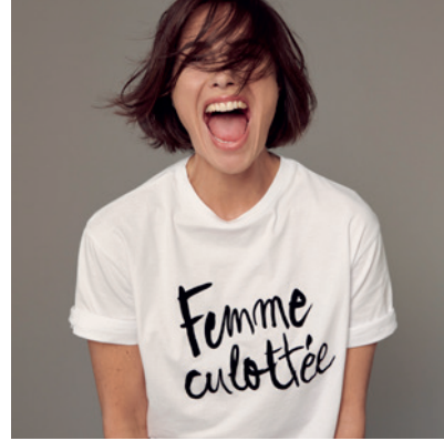
Alessandra Sublet Animatorka i producentka