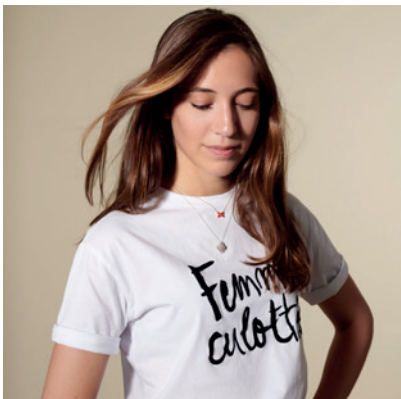
Camille Thomas Wiolonczelistka