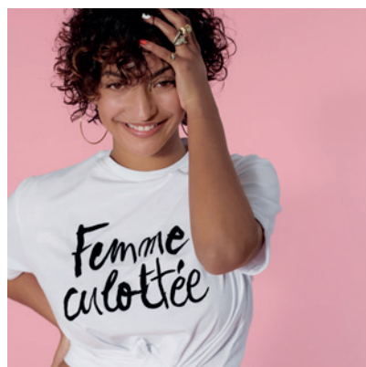
Imen Kesaly Influencerka