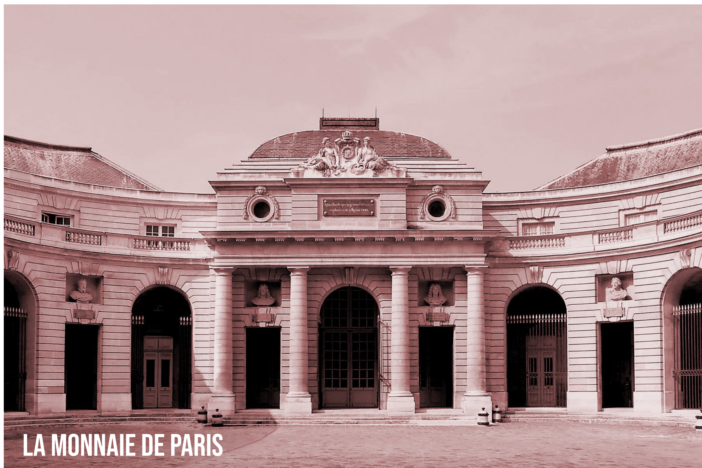
LA MONNAIE DE PARIS