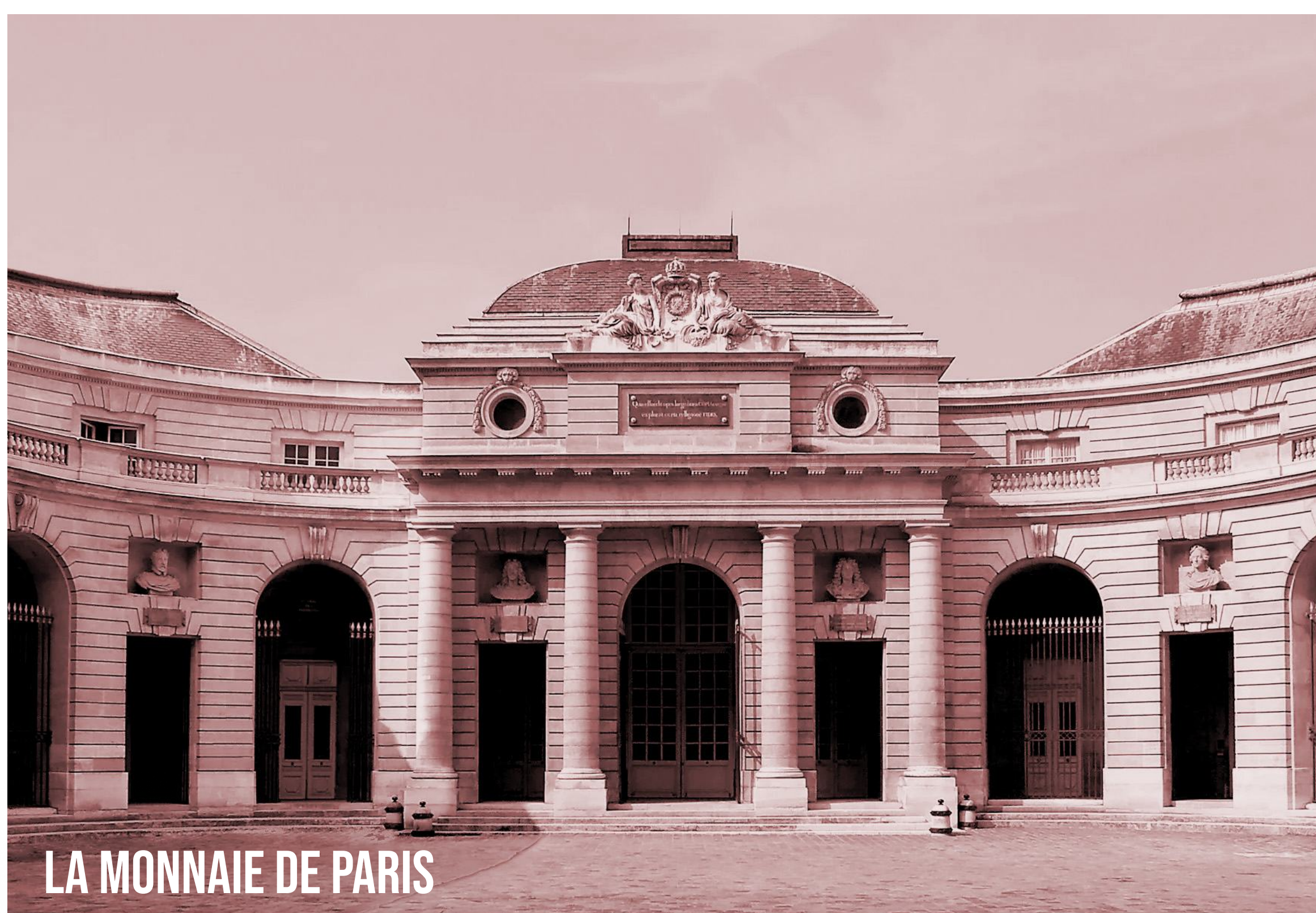
LA MONNAIE DE PARIS