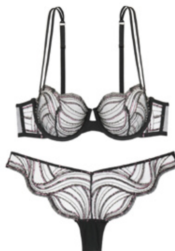
WHISPER OF DESIRE