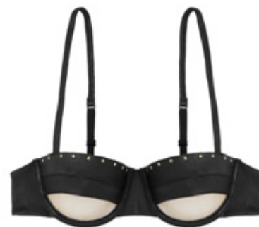
NOTHING TO HIDE