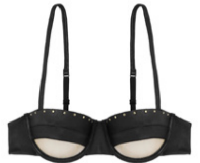
NOTHING TO HIDE