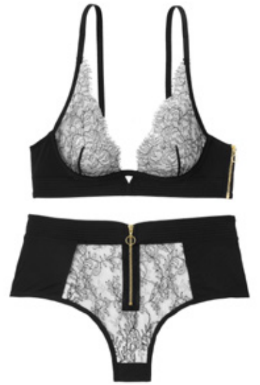
Ensemble NIGHTFALL TENTATION