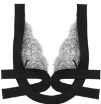
Soutien-gorge NIGHTFALL TENTATION