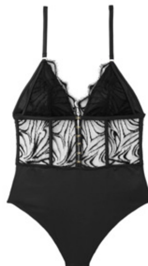
Body KEEP IT PRIVATE