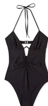
Une pièce RITA