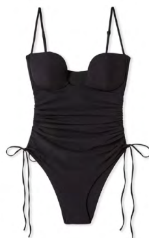
Une pièce RITA