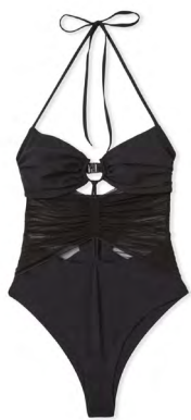
Une pièce ANIA