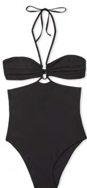
Une pièce DANA