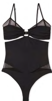
Une pièce BAYA